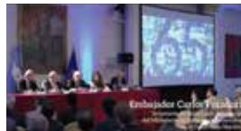
Ver video en: www.youtube.com/OIMSuramerica

En los demás países donde la OIM tiene Oficinas en América del Sur incluyendo Brasil, Chile, Colombia, Ecuador, Paraguay, Perú y Uruguay, la Organización realizó eventos especiales para celebrar el 65 aniversario conjuntamente con los gobiernos, Naciones Unidas y otros socios.