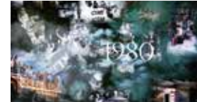
Ver video 65° Aniversario OIM