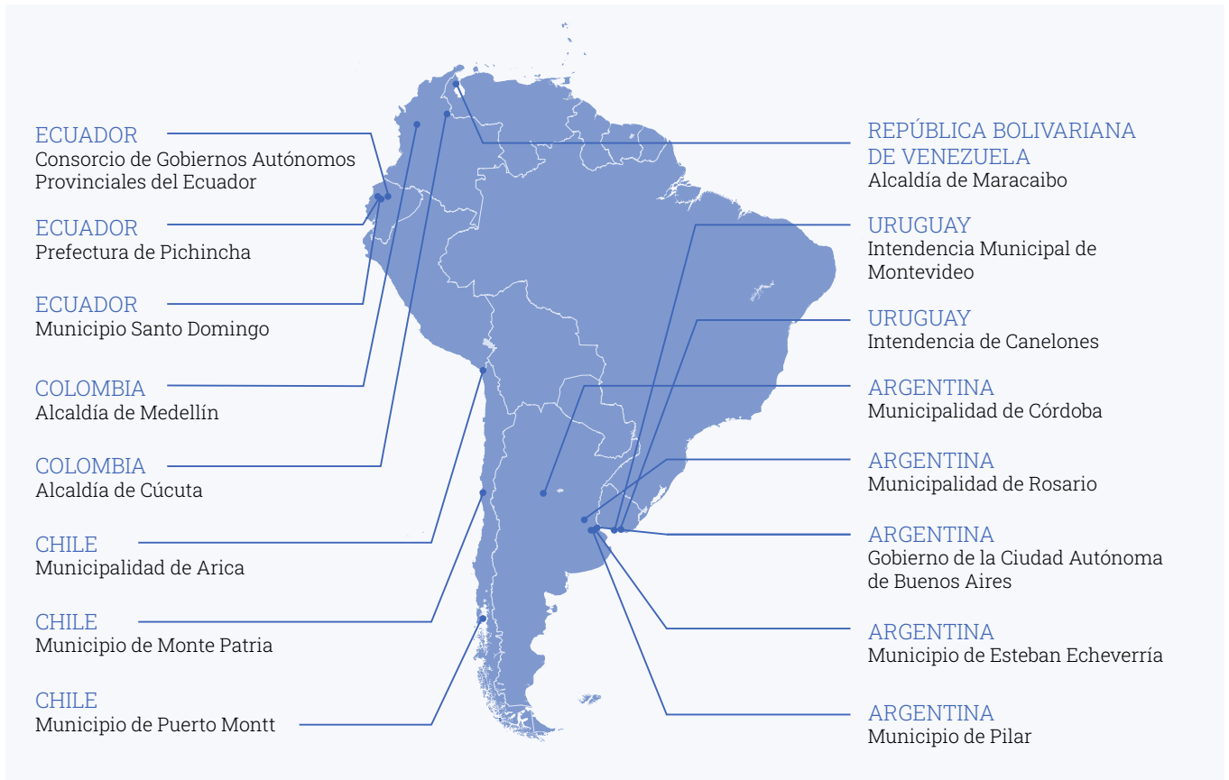
Mapa: Autoridades Locales Precursoras reconocidas de América del Sur.